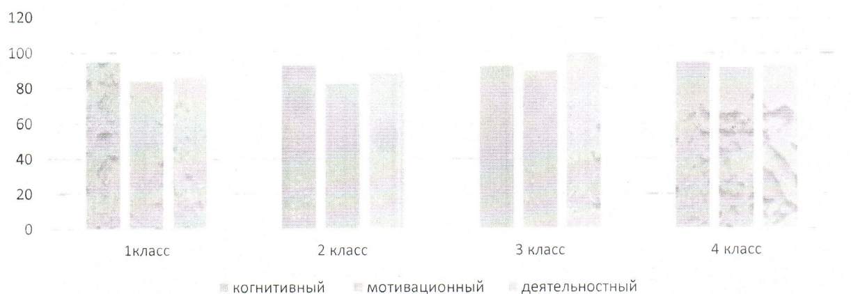
Уровень сформированности критериев профессионального самоопределения в младших классах в %

Критерии оценивались по наблюдениям педагогов.