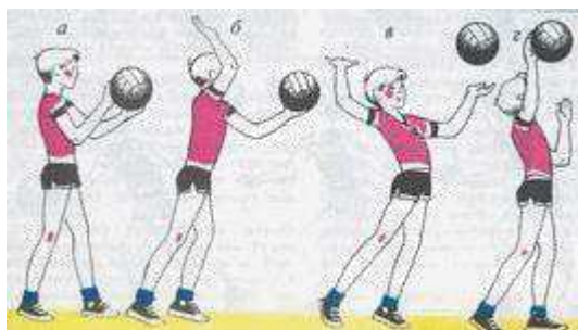
Рисунок 2 – Верхняя прямая передача

Верхняя прямая подача. В исходном положении игрок находится лицом или вполоборота к сетке. Поддерживая мяч на уровне плеча, игрок равномерно распределяет массу тела на ноги, бьющая рука согнута в локтевом суставе и подготовлена к замаху. Мяч подбрасывают несколько вперед, до 1 м выше вытянутой руки. После подбрасывания мяча бьющей рукой выполняется замах вверх-назад, прямая рука отводится назад. Во время удара бьющая рука движется вперед-вверх, удар выполняется впереди игрока. Чтобы придать мячу вращение, нужно в момент удара кисть руки накладывать на поверхность мяча так, чтобы направление силы удара не проходило через центр тяжести мяча, то есть смещать кисть руки в сторону или вверх от середины. Во всех случаях при подаче с большой начальной скоростью мяч должен вращаться вокруг горизонтальной оси. Тогда он остается в пределах площадки, хотя и имеет первоначальное направление полета вперед-вверх. Чтобы выполнить подачу без вращения мяча и вызвать его колебания, подбрасывание мяча производится без его вращения. Удар по мячу выполняется быстро и резко напряженной кистью. В этом случае мяч будет планировать (рис. 2).