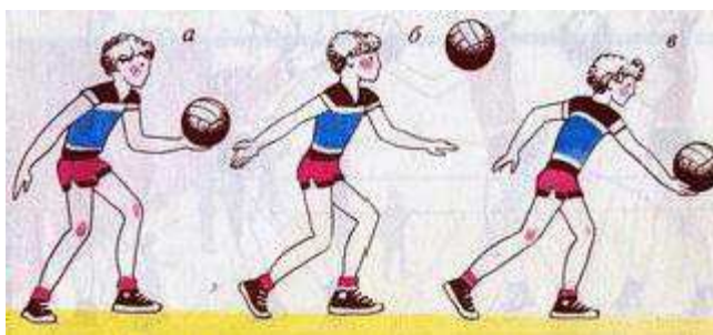
Рисунок 1 – Нижняя прямая передача

Нижняя прямая подача (см. рис. 1) выполняется из положения, при котором игрок стоит лицом к сетке, ноги в коленных суставах согнуты, левая выставлена вперед, масса тела переносится на правую стоящую сзади ногу. Пальцы левой, согнутой в локтевом суставе руки поддерживают мяч снизу. Правая рука отводится назад для замаха, мяч подбрасывается вверх-вперед на расстояние вытянутой руки. Удар выполняется встречным движением правой руки снизу-вперед примерно на уровне пояса. Игрок одновременно разгибает правую ногу и переносит массу тела на левую. После удара выполняется сопровождающее движение руки в направлении подачи, ноги и туловище выпрямляются.